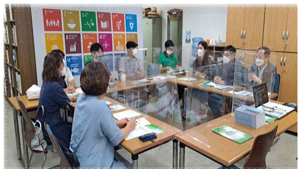
<조별 개인 강의안 발표 및 토의>