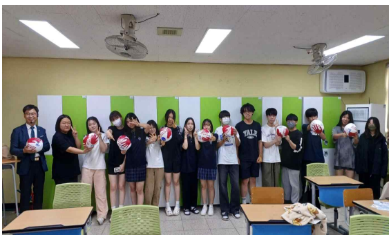
<‘소년병 반대 총대신 축구공’을 SDGs 축구공 제작>