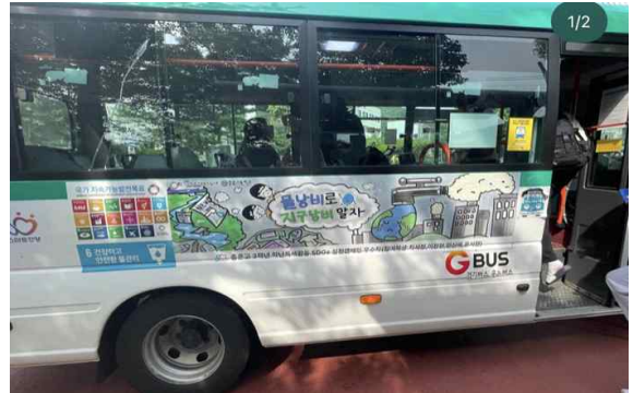
<SDG 6 '깨끗한 물' 캠페인>