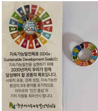
<SDGs 홍보물 : 뺏지>