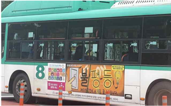
<SDG 10 '불평등 해소' 목표달성 캠페인>