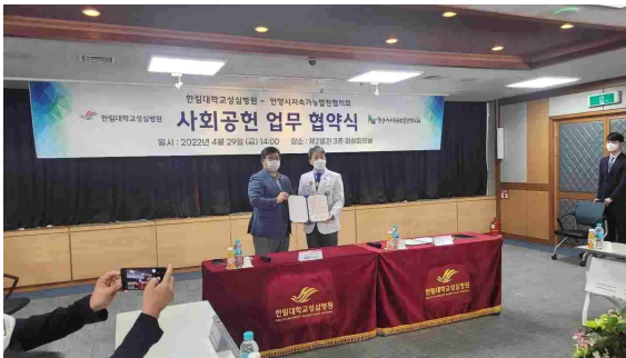
<한림대 병원과 업무협약>