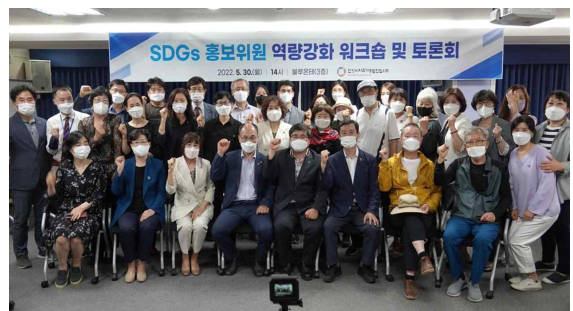
<워크숍 후 기념촬영>