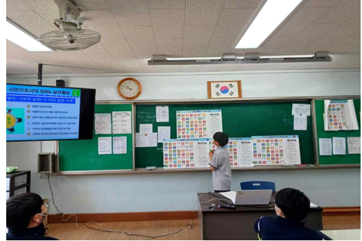
<주사위 놀이 SDGs 실습, 학생 발표>