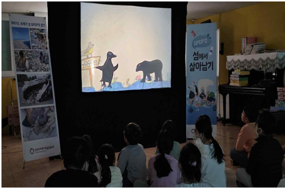
<순종지역아동센터 공연 : 어린이 대상>