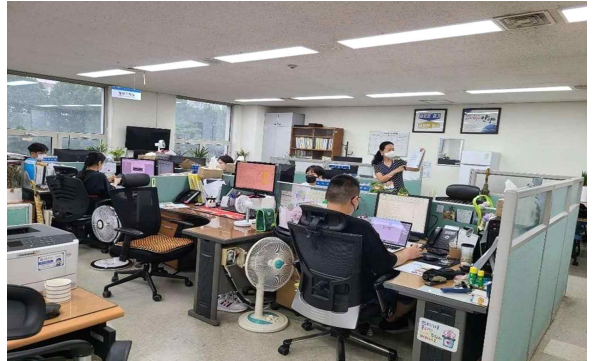
<시·구·주민센터 각 부서 방문 SDGs 홍보 및 교육>