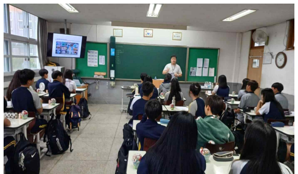
<탄소중립을 위한 ‘분리배출 실천하기’ 실습>