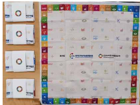
<SDGs 홍보물 : 손수건>