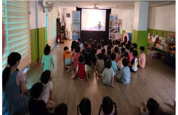
<호성 어린이집 공연 : 유아 대상>