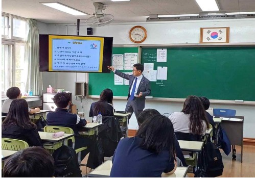
<SDGs 이론 및 세계시민교육>